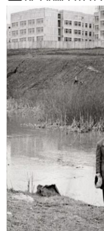
1)Нижний парк, в овраге реки Очаковка, июль 2022